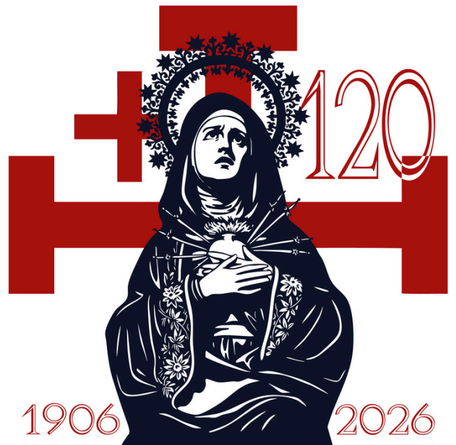
CIENTO VEINTE ANIVERSARIO DEL PASO NUESTRA MADRE DOLOROSA REAL COFRADÍA DEL SANTO SEPULCRO DE LA CIUDAD DE PALENCIA

Real Cofradía del Santo Sepulcro, Archicofradía de las Cinco Llagas de San Francisco y Cofradía de San Juan Bautista de la ciudad de Palencia C/ Lope de Vega, 10 cofradía@santosepulcro.com