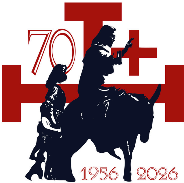
SETENTA ANIVERSARIO DEL PASO ENTRADA DE JESÚS EN JERUSALÉN REAL COFRADÍA DEL SANTO SEPULCRO DE LA CIUDAD DE PALENCIA