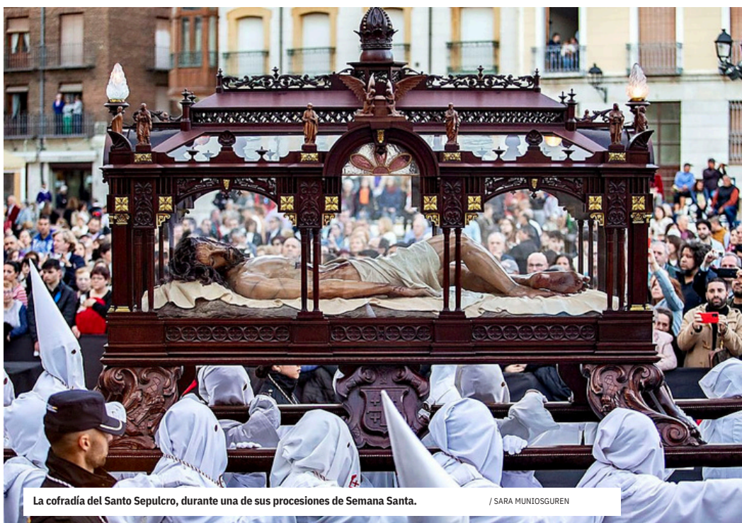
La cofradía del Santo Sepulcro, durante una de sus procesiones de Semana Santa.

La Medalla de Oro es la máxima distinción que puede otorgar la ciudad. En la práctica, es también una forma de decir qué considera valioso, qué decide preservar en su memoria y qué relatos quiere transmitir hacia el futuro. No será la primera cofradía palentina que reciba este honor, ya que en el año 2017 se aprobó su concesión para la de Jesús Nazareno y la Virgen de la Amargura. Si prospera -y todo hace indicar que así será- será la vigésima séptima que la ciudad conceda; las últimas fueron el año pasado a la Policía Nacional y a la Cámara de Comercio.